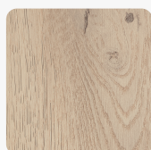
Eiche Cremona Cotta K2737 OC Oberflächenstruktur Cremona