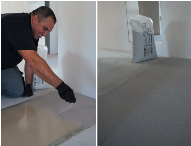
Absanden von UZIN MK 92 S mit UZIN Perlsand 0.8 bei nachfolgenden Spachtelarbeiten.

Es sind die Produktdatenblätter der mitverwendeten Produkte zu beachten.