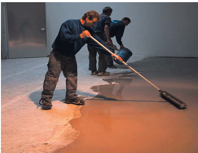
Anwendung im Verbundsystem von UZIN RR 203 NEU mit UZIN RR 201.