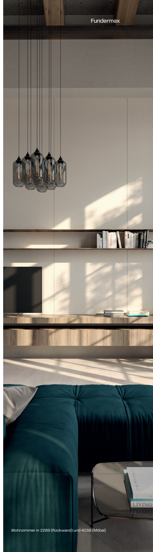
Wohnzimmer in 2289 (Rückwand) und 4038 (Möbel)

*Oberflächen und Dekore laut gültigem Fundermax Lieferprogramm.