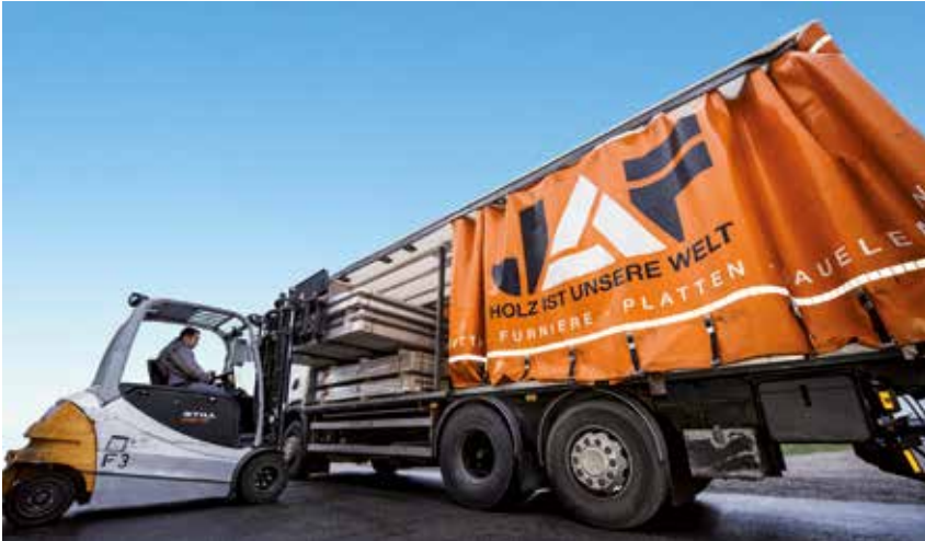
Viele Produkte sind bei J. u. A. Frischeis ständig auf Lager und somit auch schnell für den Kunden verfügbar

Produktmanager auf die Frischeis-Sortimentsvielfalt ein.