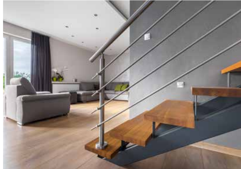
Für die unterschiedlichsten Anwendungen gibt es bei J. u. A. Frischeis passende Produkte

te bei J. u. A. Frischeis, fest. Das Sortiment der Massivholzplatten aus Laubholz hat J. u. A. Frischeis deutlich erweitert. „Wir haben das Lagersortiment der Frischeis-Eigenmarke Eurowood verdreifacht“, informiert Kühner. Platten aus den wichtigsten Holzarten, wie Eiche, Buche, Nuss, Birke, Ahorn und Erle, sind beim Holzgroßhändler kurzfristig verfügbar. Die Oberflächen der Platten sind beidseitig geschliffen. Somit kann die Massivholzplatte den individuellen Bedürfnissen angepasst und geölt, gewachst, lasiert oder lackiert werden.