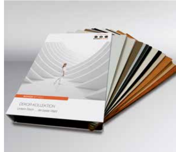
Die Eurowood-Dekorkollektion hat ein Update bekommen

Die große Holzwerkstoff-Auswahl ist auch bei den JAF-Bearbeitungsservices spürbar – wie beispielsweise beim Onlinezuschchnitt WebCut: Hier können Kunden von J. u. A. Frischeis nicht nur alle verfügbaren Plattenprodukte per Mausclick zuschneiden lassen, sondern auch aus allen Kollektionen wählen – und das 24 Stunden am Tag sieben Tage in der Woche. WebCut ist damit Österreichs größter Online-Service für Zuschnitte.