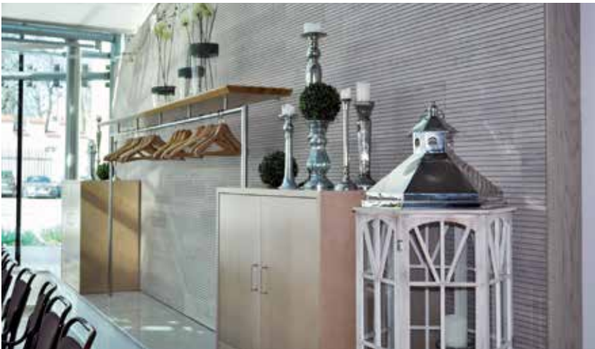
Akustikpaneele aus Massivholz: Mit Admonter Acoustics lassen sich Räume mit natürlichen Materialien gestalten