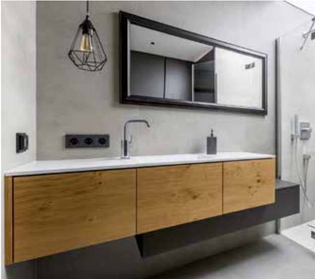
Massivholzplatten vermitteln Wertigkeit , deshalb werden sie gerne im modernen Innenausbau eingesetzt