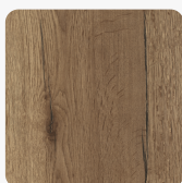
Halifax Eiche tabak H1181 ST37 Oberflächenstruktur Feelwood Rift