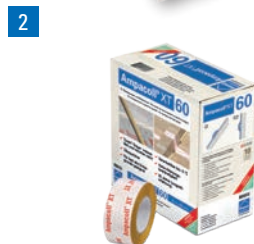
2 Ampacoll® XT 60: Acrylklebeband