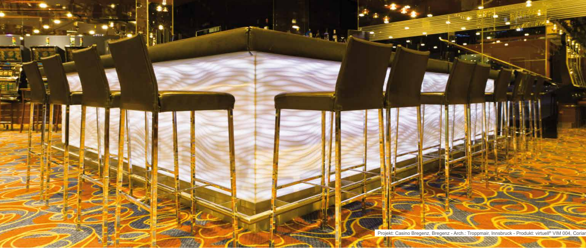
Projekt: Casino Bregenz, Bregenz - Arch.: Troppmair, Innsbruck - Produkt: virtuell® VIM 004, Corian®