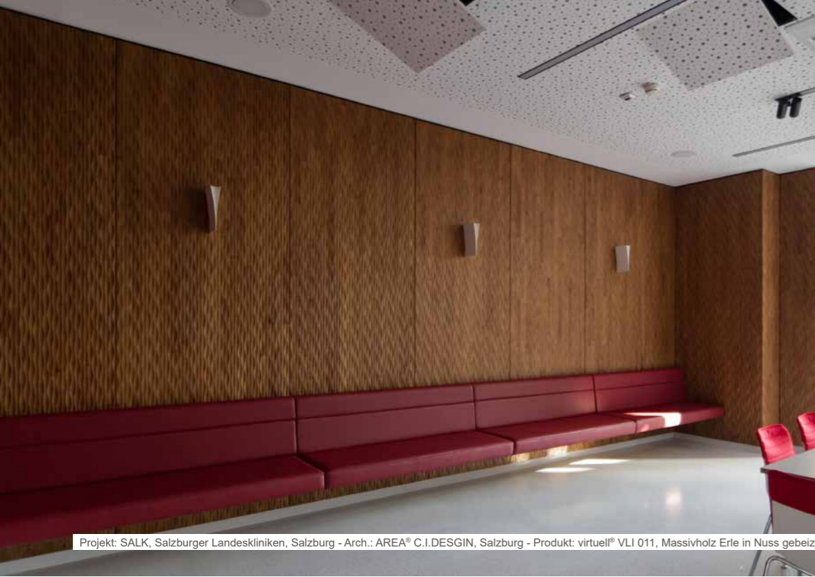
Projekt: SALK, Salzburger Landeskliniken, Salzburg - Arch.: AREA® C.I.DESGIN, Salzburg - Produkt: virtuell® VLI 011, Massivholz Erle in Nuss gebeizt