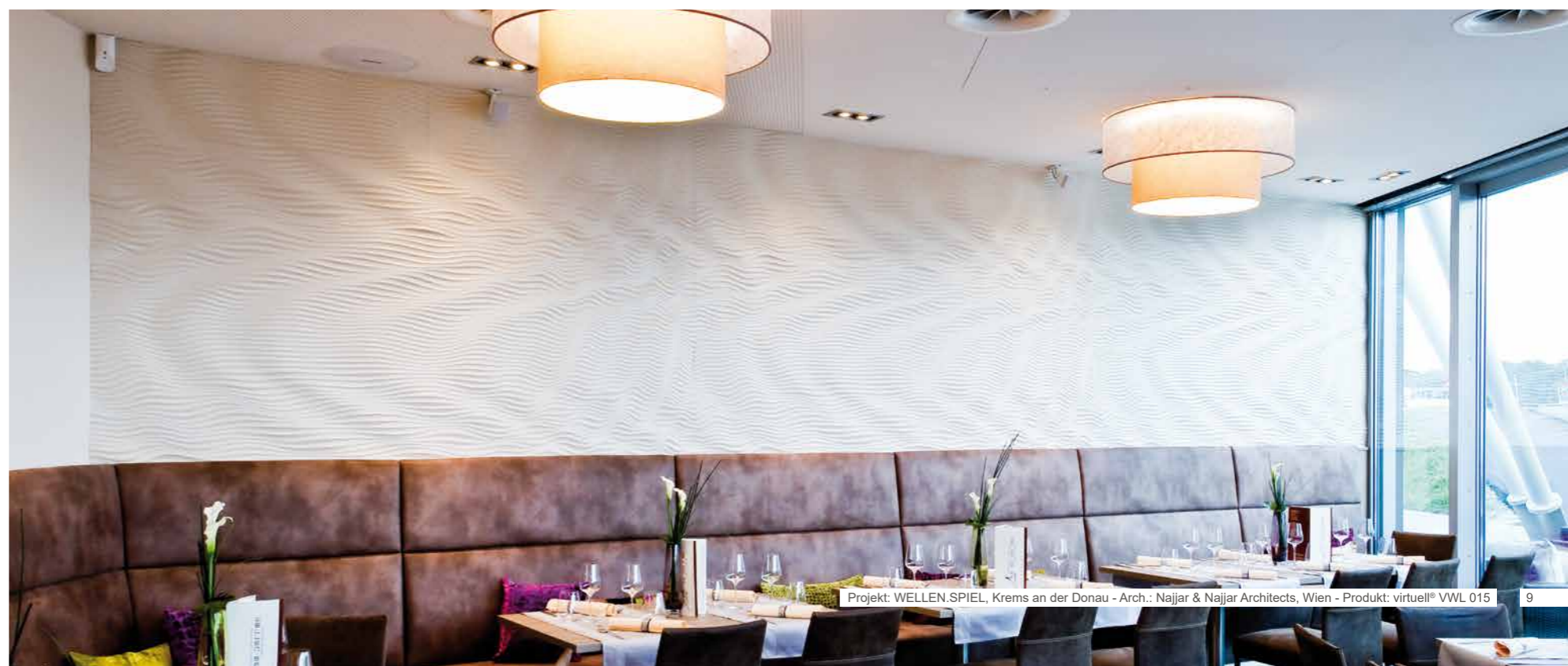
Projekt: WELLEN.SPIEL, Krems an der Donau - Arch.: Najjar & Najjar Architects, Wien - Produkt: virtuell® VWL 015

Ihre virtuellen Wünsche werden Realität.