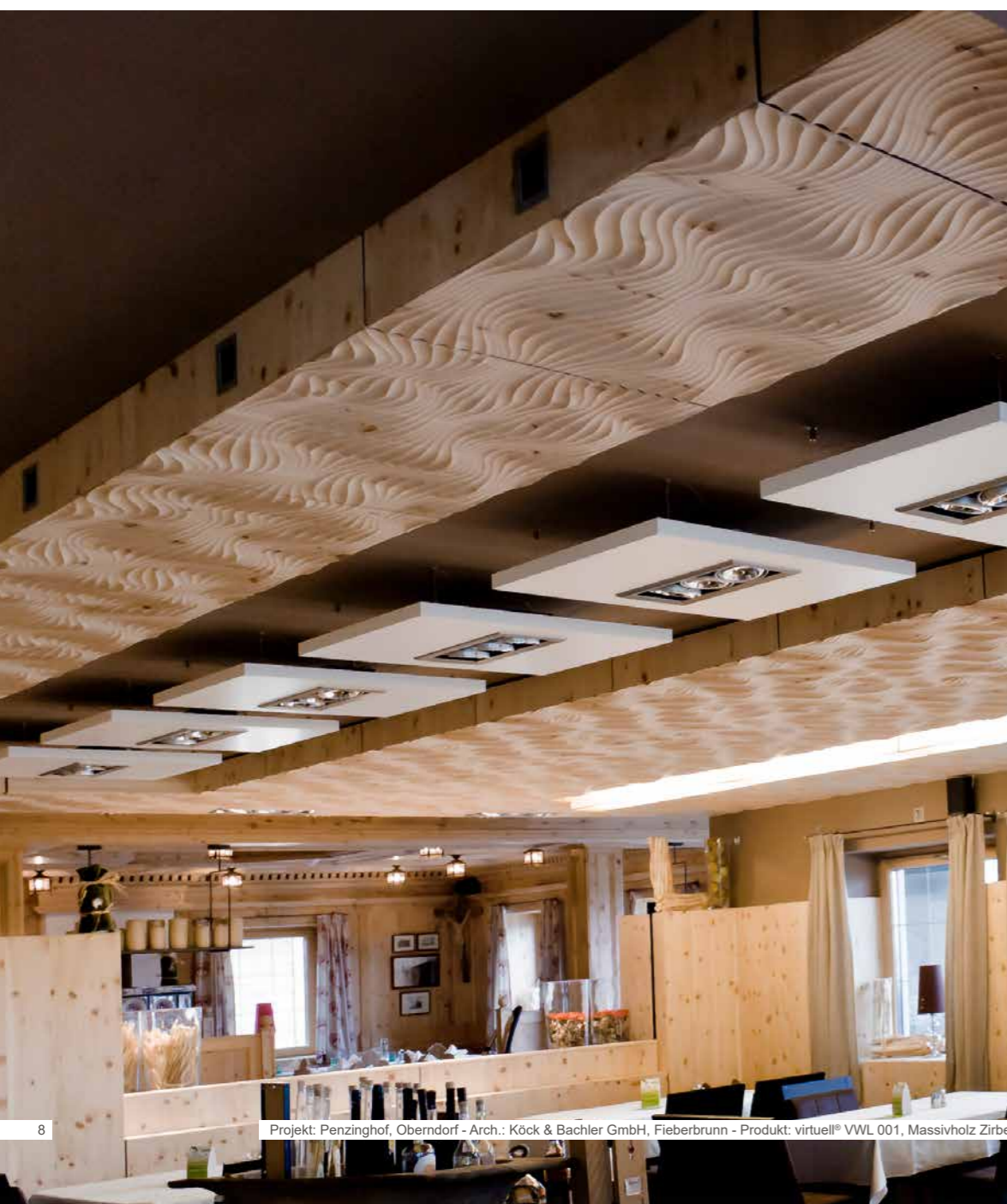
Projekt: Penzinghof, Oberndorf - Arch.: Köck & Bachler GmbH, Fieberbrunn - Produkt: virtuell® VWL 001, Massivholz Zirbe

Das Dekor verläuft anhand Ihrer Wünsche fließend über Ecken, Gehrungen und Rundelemente. Ebenso realisieren wir Ihre Details um Logos und Einbauteile wie Schalter und Steckdosen in die virtuell® Elemente zu integrieren.