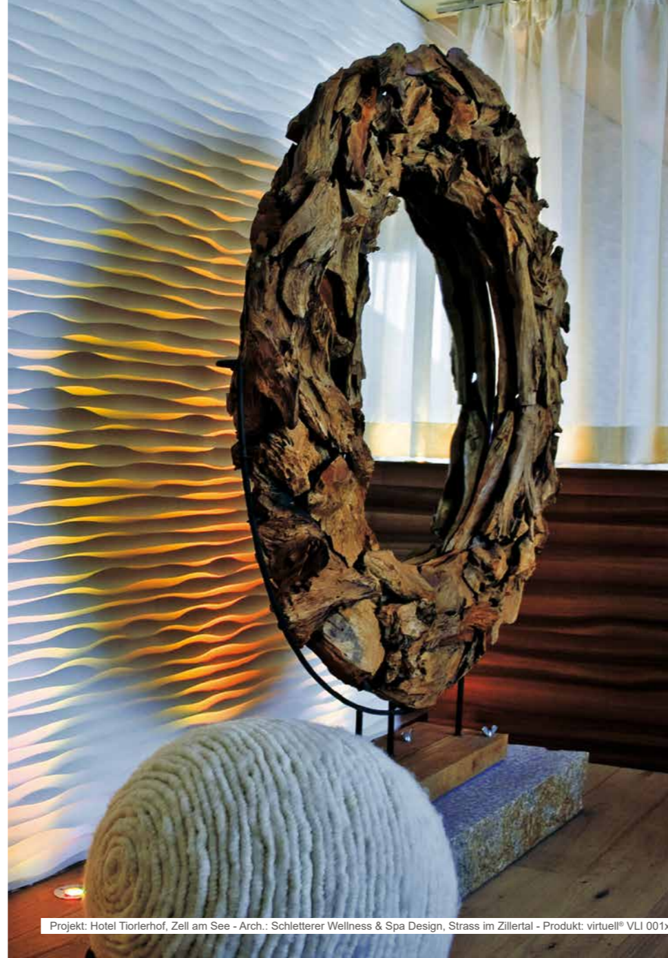
Projekt: Hotel Tiorlerhof, Zell am See - Arch.: Schletterer Wellness & Spa Design, Strass im Zillertal - Produkt: virtuell® VLI 001x2