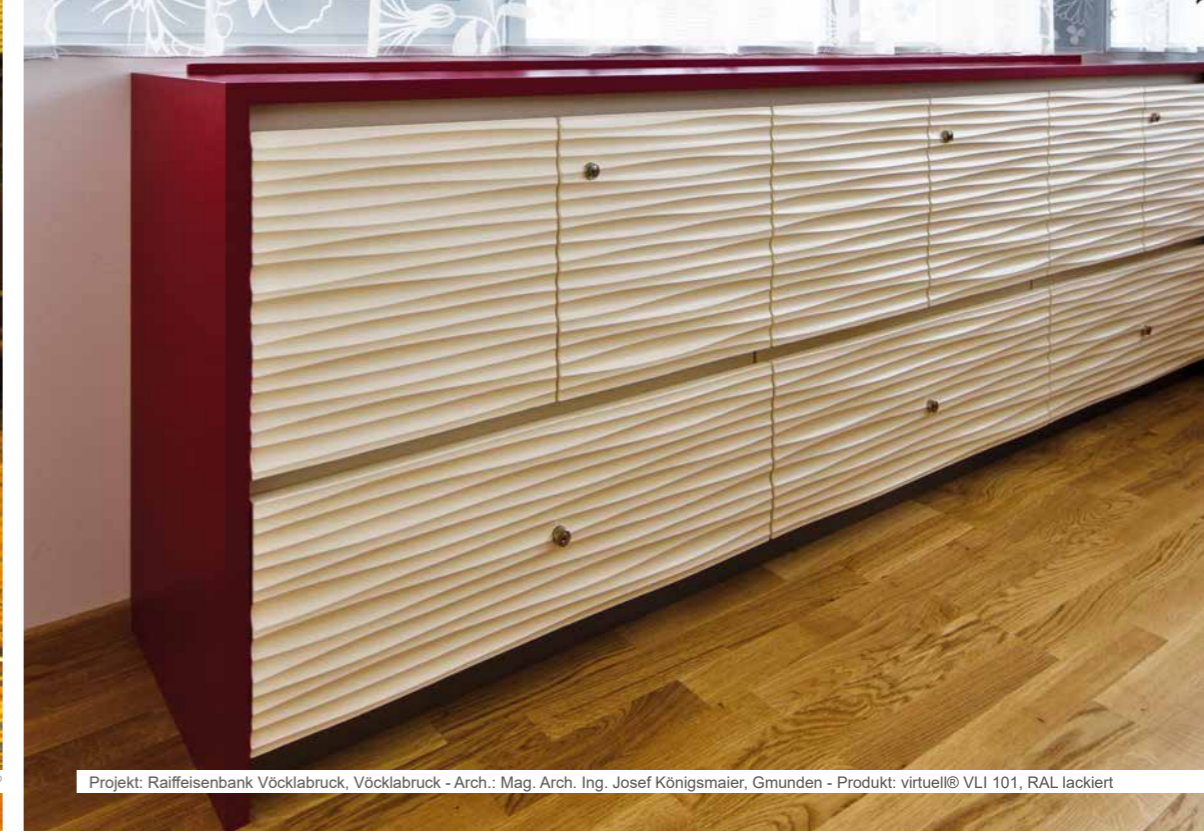
Projekt: Raiffeisenbank Vöcklabruck, Vöcklabruck - Arch.: Mag. Arch. Ing. Josef Königsmaier, Gmunden - Produkt: virtuell® VLI 101, RAL lackiert