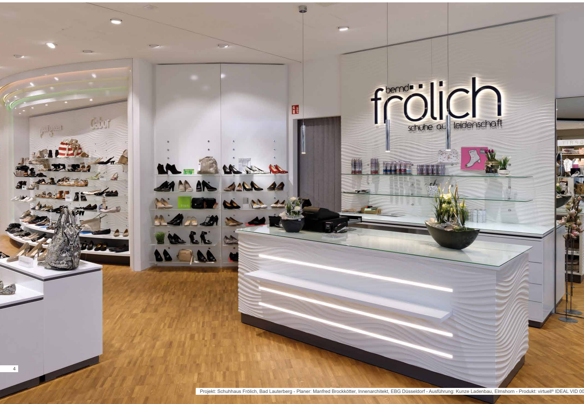
Projekt: Schuhhaus Fröhlich, Bad Lauterberg - Planer: Manfred Brockkötter, Innenarchitekt, EBG Düsseldorf - Ausführung: Kunze Ladenbau, Elmshorn - Produkt: virtuell® IDEAL VID 006