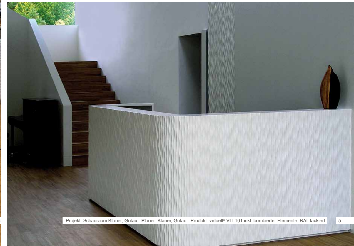
Projekt: Schauraum Klaner, Gutau - Planer: Klaner, Gutau - Produkt: virtuell® VLI 101 inkl. bombierter Elemente, RAL lackiert

Materialien wie Holz, MDF, Faserzement, Mineralwerkstoffe, Acryl und viele mehr veredelt mit einzigartigen Reliefs geben Ihrem Projekt Struktur.